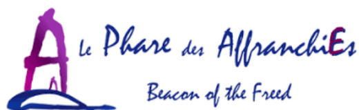
Table régionale contre la traite à des fins d'exploitation sexuelle

Pour plus d'informations direction@affranchies.ca